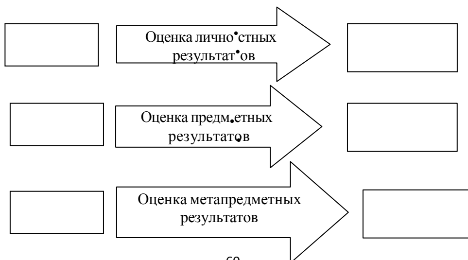
Рис. 1. Влияние системы оценки на образовательную деятельность